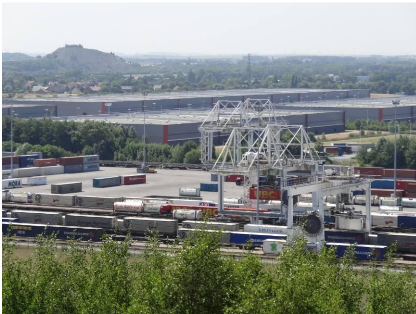
Illustration 3 Plateforme delta 3 un terminal de transport multimodal (rail – route – voie d'eau).