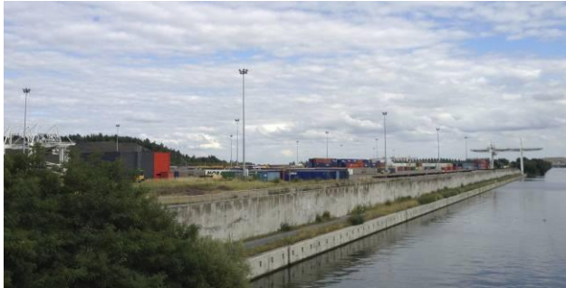
Illustration 2 Plateforme Delta 3, terrils du bassin minier et canal de la Haute-Deûle

Programme • ITTEGOP Infrastructures de transports terrestres, écosystèmes et paysages