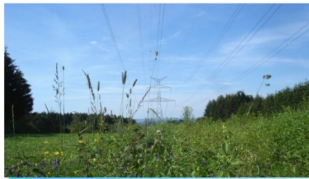
Actions | Actions de restauration Prairies fleuries allégées